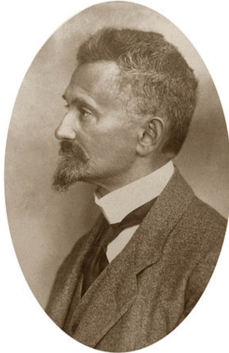
Felix Hausdorff (1868 – 1942)