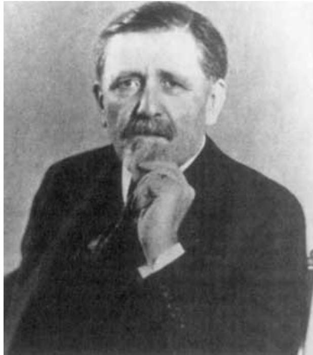
Émile Borel (1871 – 1956)